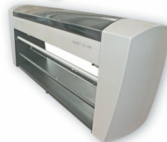
WIND-CL 180 WIND-CL 205 WIND-CL 240