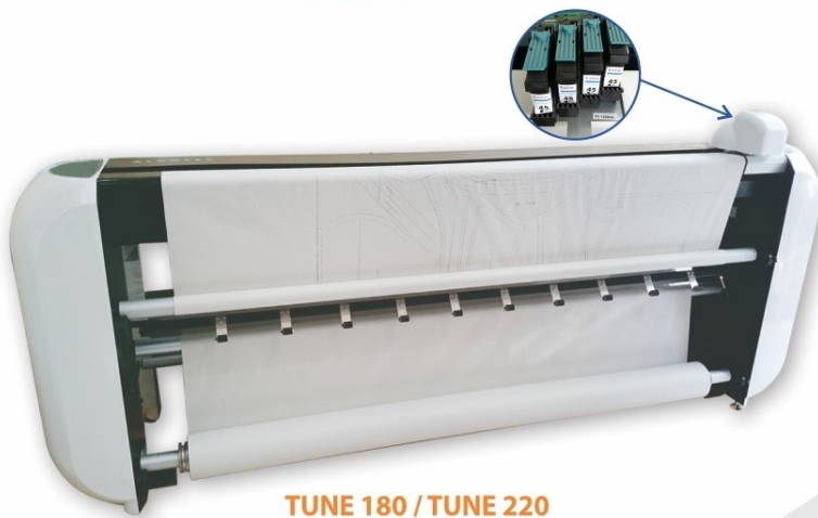
TUNE 180 / TUNE 220