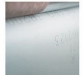
IN chính xác, tuyệt vời; tốc độ cao