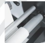
IN XÀ GIẤY cấp giấy tốt; chính xác tối đa