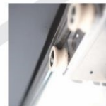
TRỤC CHÍNH chủ động, trơn mượt, ray dôi hợp kim nhôm

VEGA P là dòng máy in sơ đồ đầu tiên trên thế giới có tích hợp màn hình chạm cảm ứng để theo dõi và điều khiển.